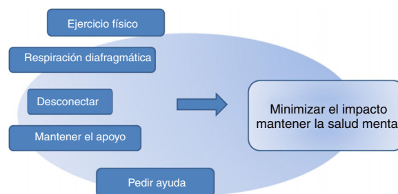
Figura 1 Recomendaciones finales para afrontar el impacto emocional 22-32 .

A la luz de lo comentado hasta este momento queda patente la necesidad específica de intentar minimizar el impacto emocional de la epidemia en los trabajadores de la salud.